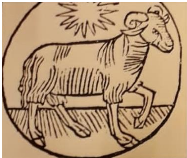
« La beste à laine »