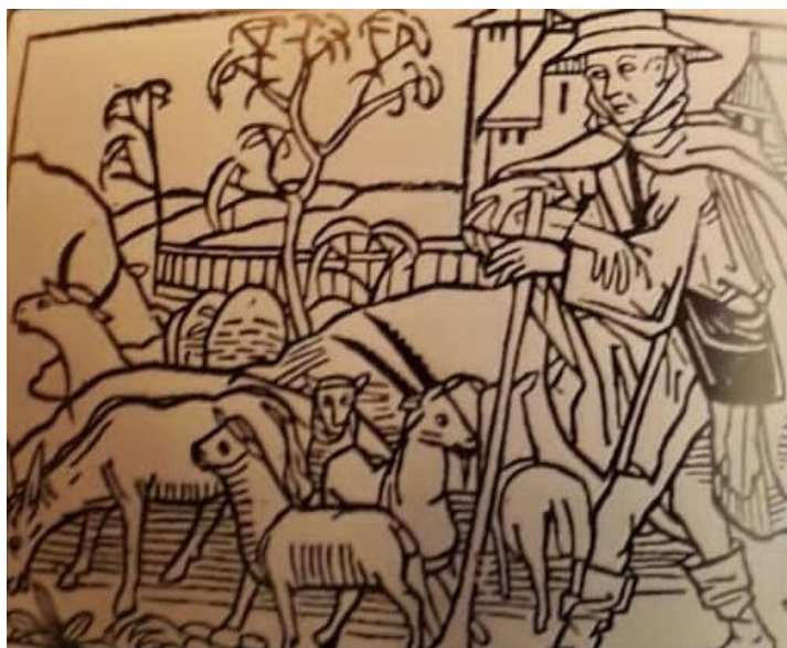
« Le berger »