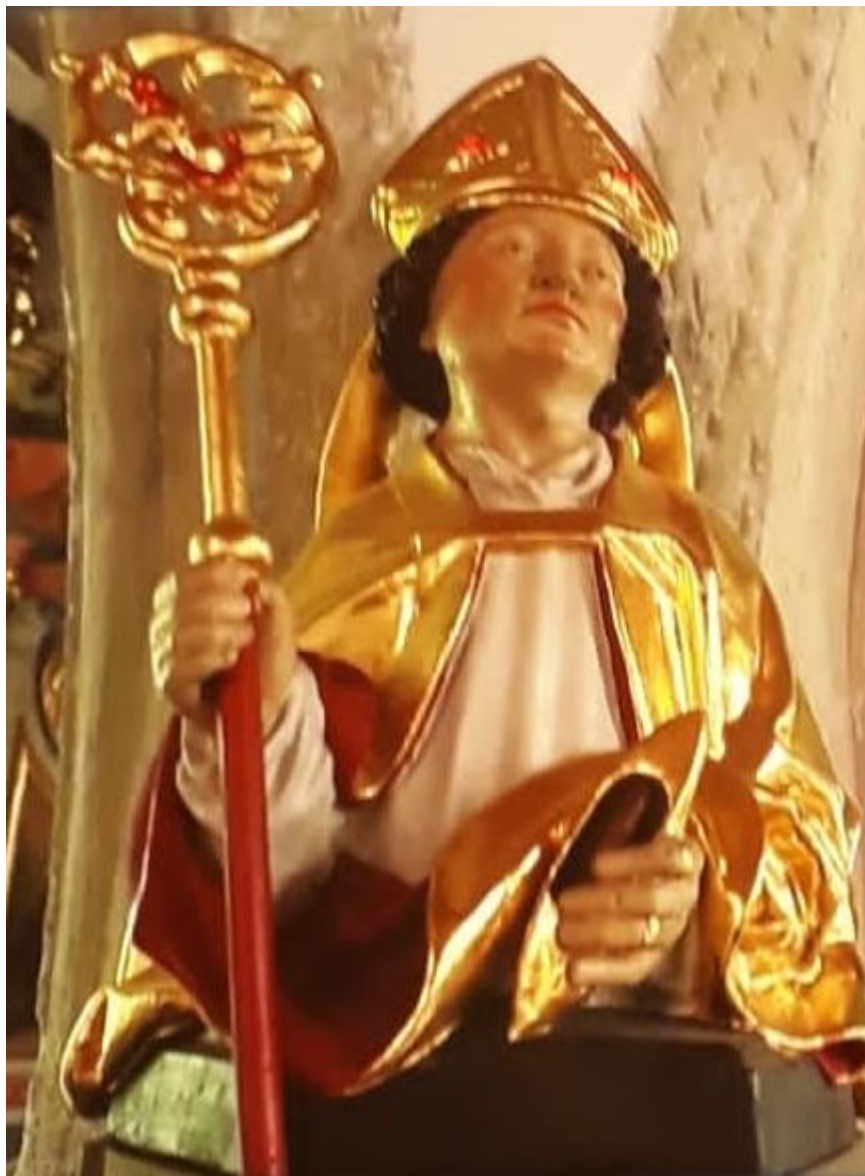
Eglise St.-Jean Neuveville Fribourg