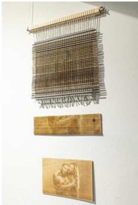
"Photo de famille". Jamie-Lee Duvieusart. Technique : Ikat de gravure laser