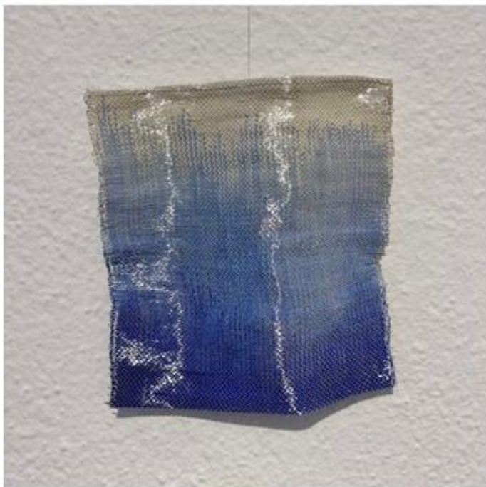
"Revoir la mer". Orlane Favre. Matières : peinture sur soie, fils métalliques

Dans cette exposition, les tisserandes ont exploré différentes techniques et différents matériaux pour réaliser leurs créations :