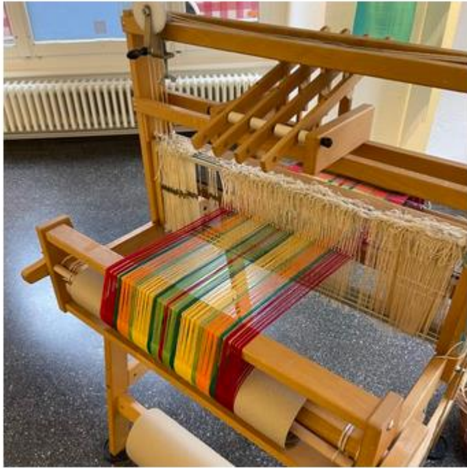
Métier à tisser

« Labo Textile » est à découvrir jusqu'au 13 mars, à l'Espace 81, à Morges. Les mercredis et samedis, deux tisserandes sont sur place pour présenter leurs créations.